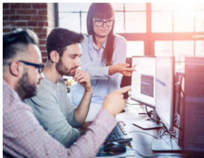
Viele Unternehmen suchen derzeit vermehrt nach neuem Personal.

(djd). Selten standen die Chancen auf einen neuen Job so gut wie derzeit. Einige Branchen suchen händeringend nach Mitarbeiterinnen und Mitarbeitern. Sie bieten gute Jobchancen für Quereinsteigerinnen und Quereinsteiger sowie Arbeitslose, die sich weiterbilden. Die Agentur für Arbeit unterstützt Weiterbildungen und Umschulungen. Nach einer Umfrage des Marktforschungsinstituts YouGov in Zusammenarbeit mit GFN wissen 32 Prozent der Arbeitssuchenden allerdings nicht, dass sie sich kostenfrei umschulen oder weiterbilden lassen können. Zu den wichtigsten Fördertöpfen zählen der Bildungsgutschein und die Weiterbildungsprämie. Genauere Infos dazu finden Interessierte unter www.gfn.de/foerderung . Ein Bildungsgutschein kann auch genutzt werden, um drohende Arbeitslosigkeit zu vermeiden.